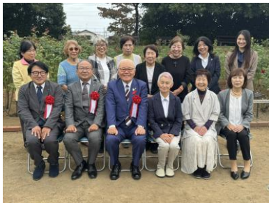
女性部40周年記念式典の様子

色鮮やかなバラが咲き誇る日を楽しみにしながら、40年の歩みを胸に、これからも地域に根ざした活動を通じて、より豊かで魅力あるまちづくりに努めてまいります。