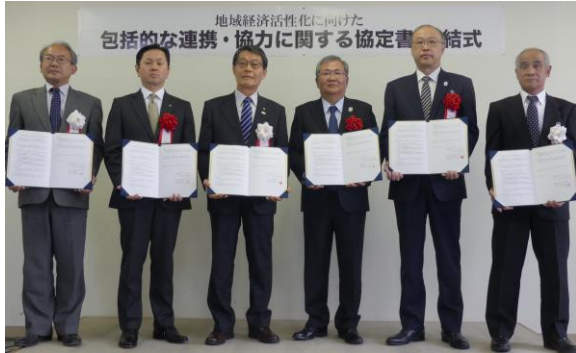
▲協定書を持つ各金融機関代表と商工会正副会長