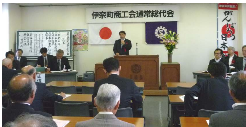
▲挨拶をする東会長

総代会において承認されました詳細につきましては、総代会資料をお届けしましたのでご覧ください。